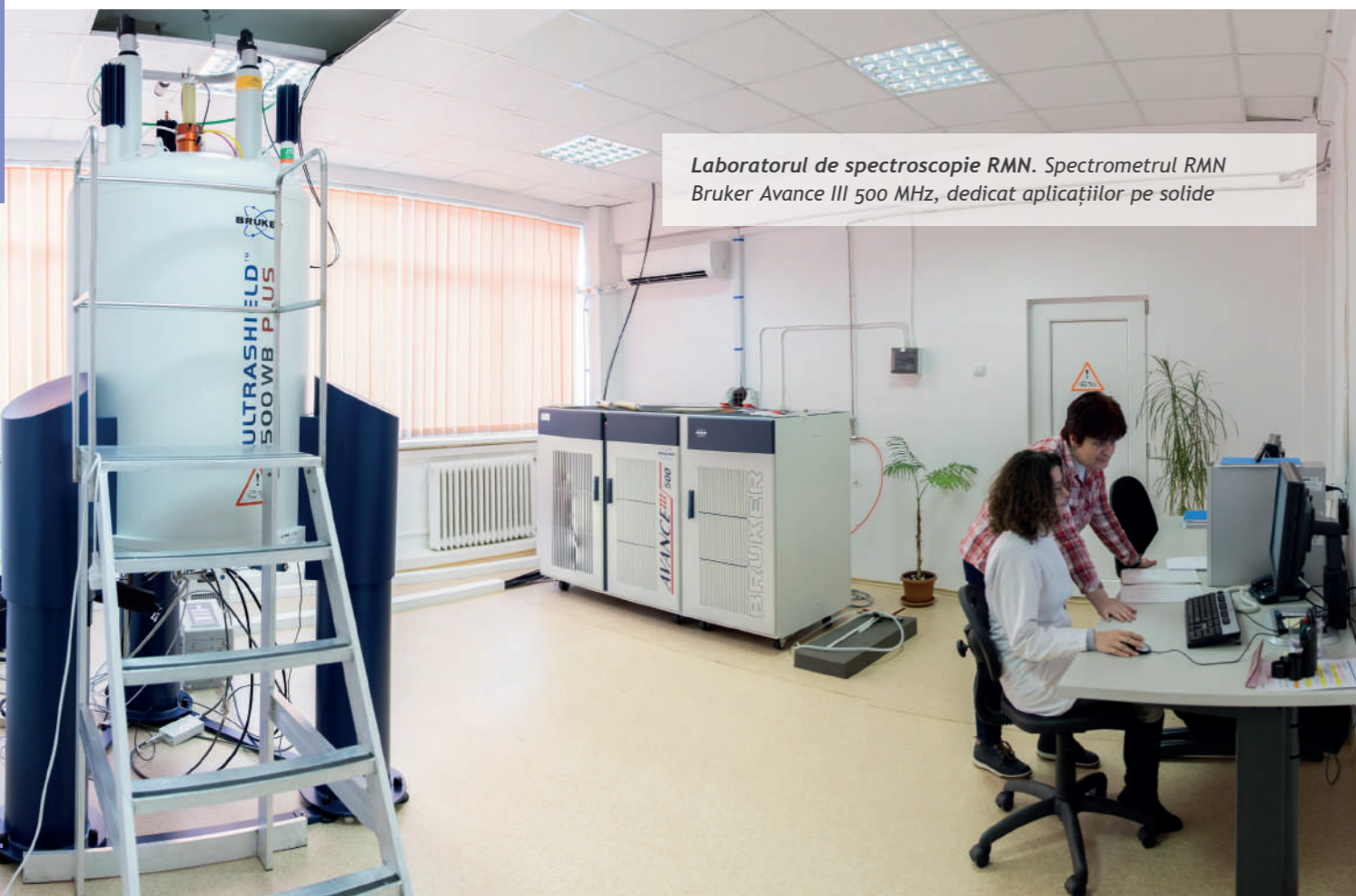
Laboratorul de spectroscopie RMN. Spectrometrul RMN Bruker Avance III 500 MHz, dedicat aplicațiilor pe solide