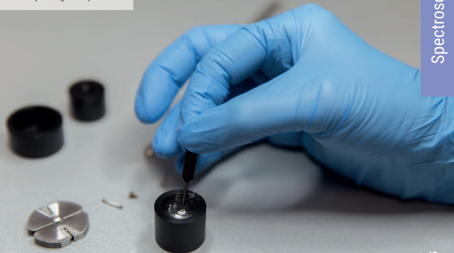
Introducerea probei (pulbere) în rotor