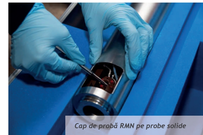
Cap de probă RMN pe probe solide